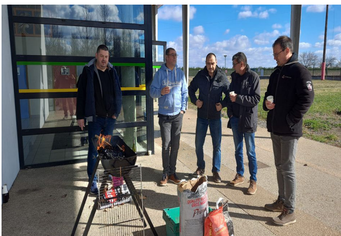
De gauche à droite : F4JFN, F5PAL, F4HV, F4JYF, F4JMX.

La mise en place de couchages de façon permanente a permis d'accueillir des OM la veille du contest, ce qui a eu pour effet de pouvoir démarrer sans fatigue.